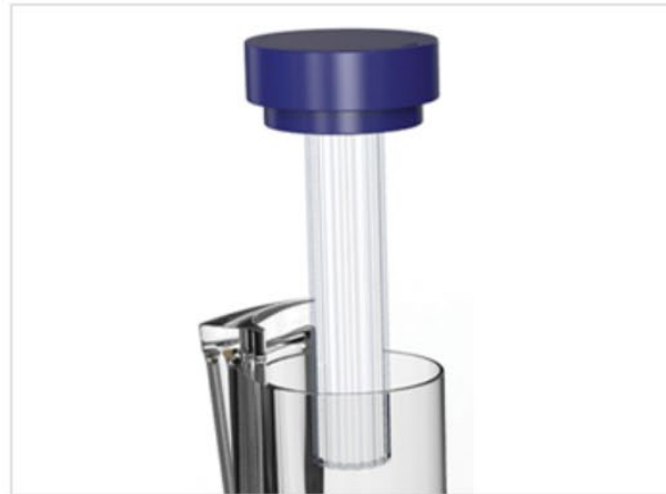
기어모양의 얼음봉을 적용하여 냉각 효율성 증대 시킴