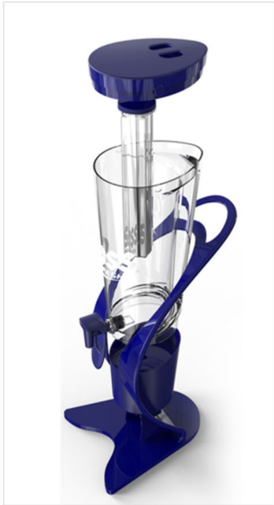
전체적인 분해를 쉽게하게 하여 세척 용이 및 세척 시간 단축