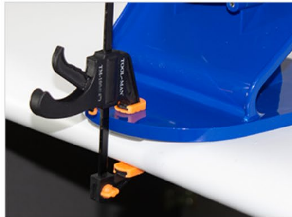
고정핀 선택 적용으로 스탠딩 안전성 확보