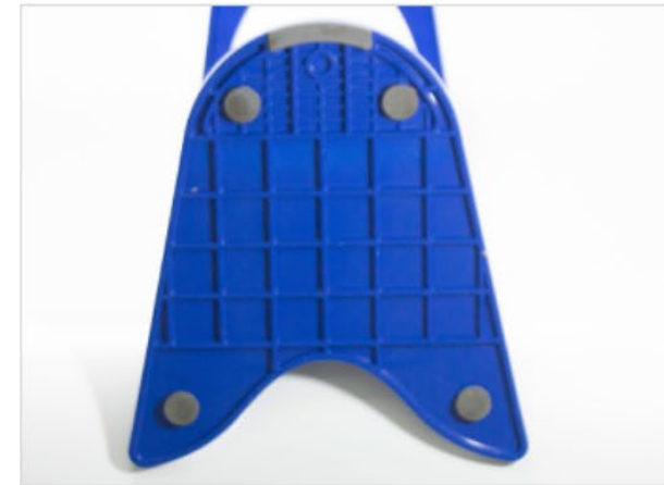
바닥판 실리콘 고무 부착을 통한 밀림 현상 방지 (생맥주 추출 시 안정성 확보)