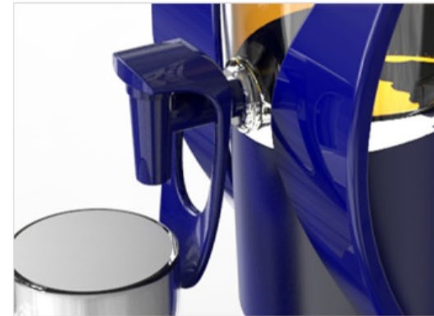
분리 가능한 정수기 탭을 사용하여 세척 및 교환 용이